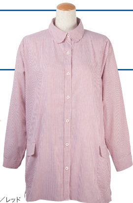
ストライプ/レッド