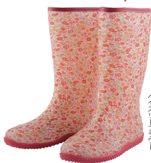
ベイズリーブルー