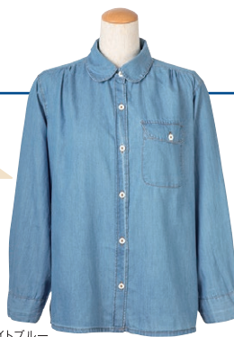
インディゴライトブルー