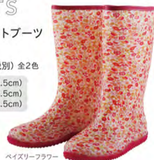
ベイズリーフラワー

SS (22.5~23.5cm) S (23.5~24.5cm) M (24.5~25.5cm)