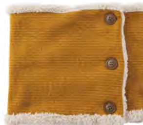
マスタード ×ゴールド