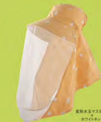
変形水玉マスタード × ホワイトネット