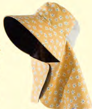
ローレンティアイエロー