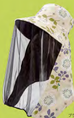
紫陽花 × ブラックネット