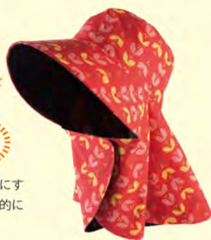
チューリップレッド